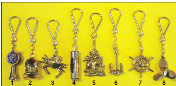
Portachiavi in ottone / Brass key ring