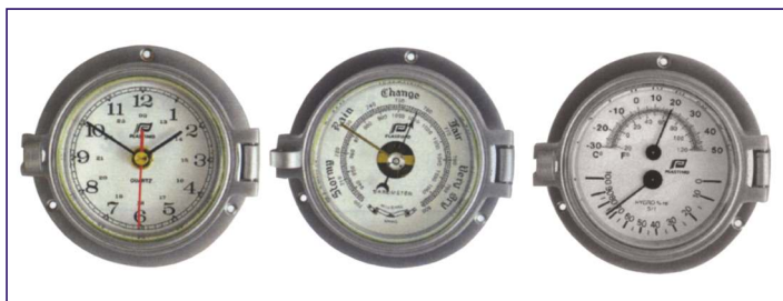
Plastimo serie 3 pollici: cassa cromatura opaca, vetro smussato. Quadrante: Ø 7,5 cm, Ø base 12 cm.

Code # 5318 - Termometro e igrometro / hygrometer and thermometer