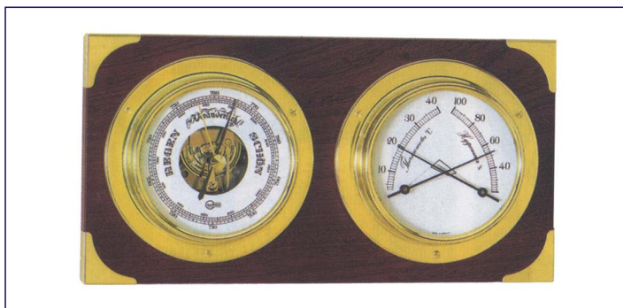
Barigo Barometro e termo-igrometro: montato su tavoletta di legno verniciata. Casse in ottone lucido verniciate a fuoco (quadranti 85mm).

Barigo Barometer and Thermo-hygrometer: mounted on a wooden varnished table (bright brass dial Ø 85mm).