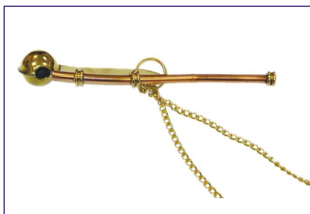
Fischiello nostromo: con catenella.