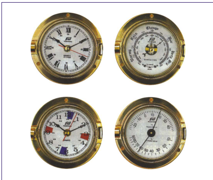
Plastimo serie 3 pollici: cassa in ottone massiccio, vetro smussato. Quadrante: Ø 7,5 cm, Ø base 12 cm.

Plastimo 3": massive brass case, bevelled glass edge. Dial Ø3". Base Ø4.7".