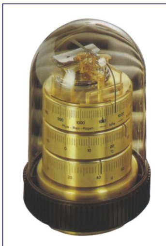
Barigo Baro-termo-igrometro: da tavolo in chiesuola. Ottone e resina acrilica.

Barigo Baro-Thermo-hygrometer: for table in binnacle. Brass and synthetic resin.