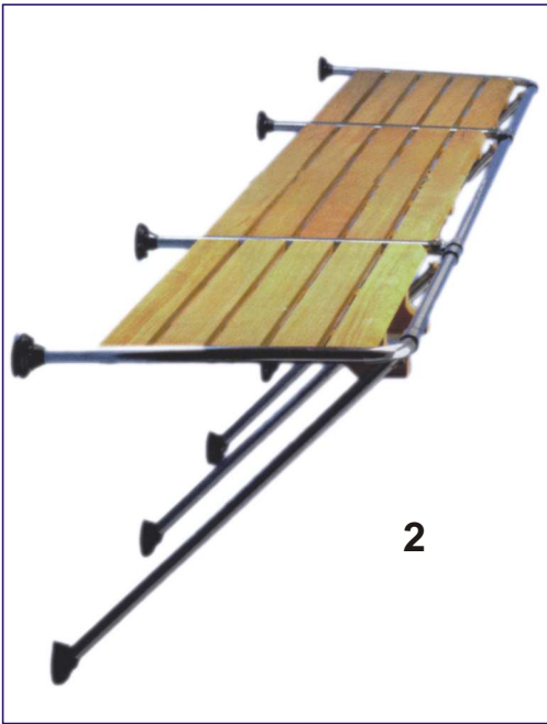
2) Modello "Ustica" diviso in 3 luci. "Ustica" model with three movable supports. Code # 11196 - 55x170 cm Code # 11197 - 55x200 cm Code # 11198 - 55x230 cm

Plancette di poppa in acciaio inox e legno Doussie. Sono provviste di attacchi distanziatori telescopici in acciaio inox e snodi in plastica, che consentono una perfetta sistemazione della plancetta sulle varie inclinazioni degli specchi di poppa. Tubo da mm 25, predisposte per montaggio scaletta e supporto motore ausiliario.